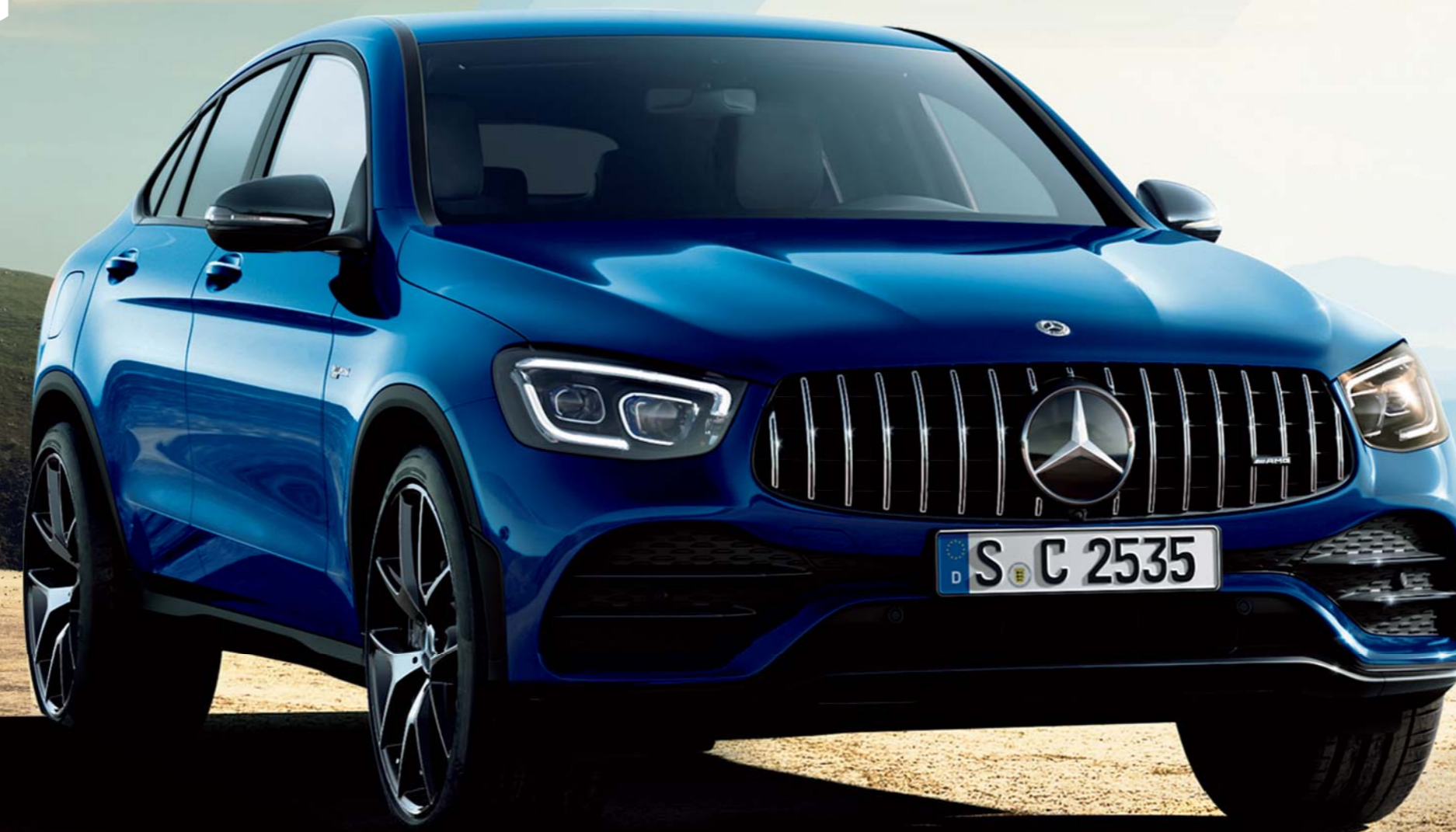
Mercedes-AMG GLC 43 4MATIC Coupé