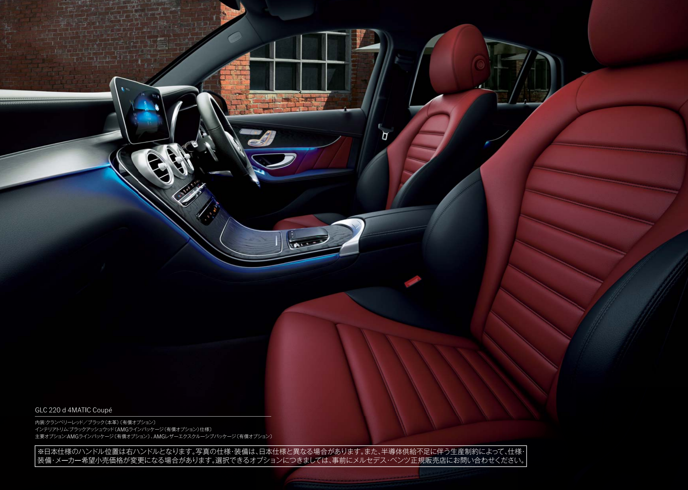
GLC 220 d 4MATIC Coupé

内装: クランベリーレッド/ブラック(本革) (有償オプション) インテリアトリム: ブラックアッシュウッド (AMGラインパッケージ (有償オプション) 仕様) 主要オプション: AMGラインパッケージ (有償オプション)、AMGレザーエクスクルーシブパッケージ (有償オプション)