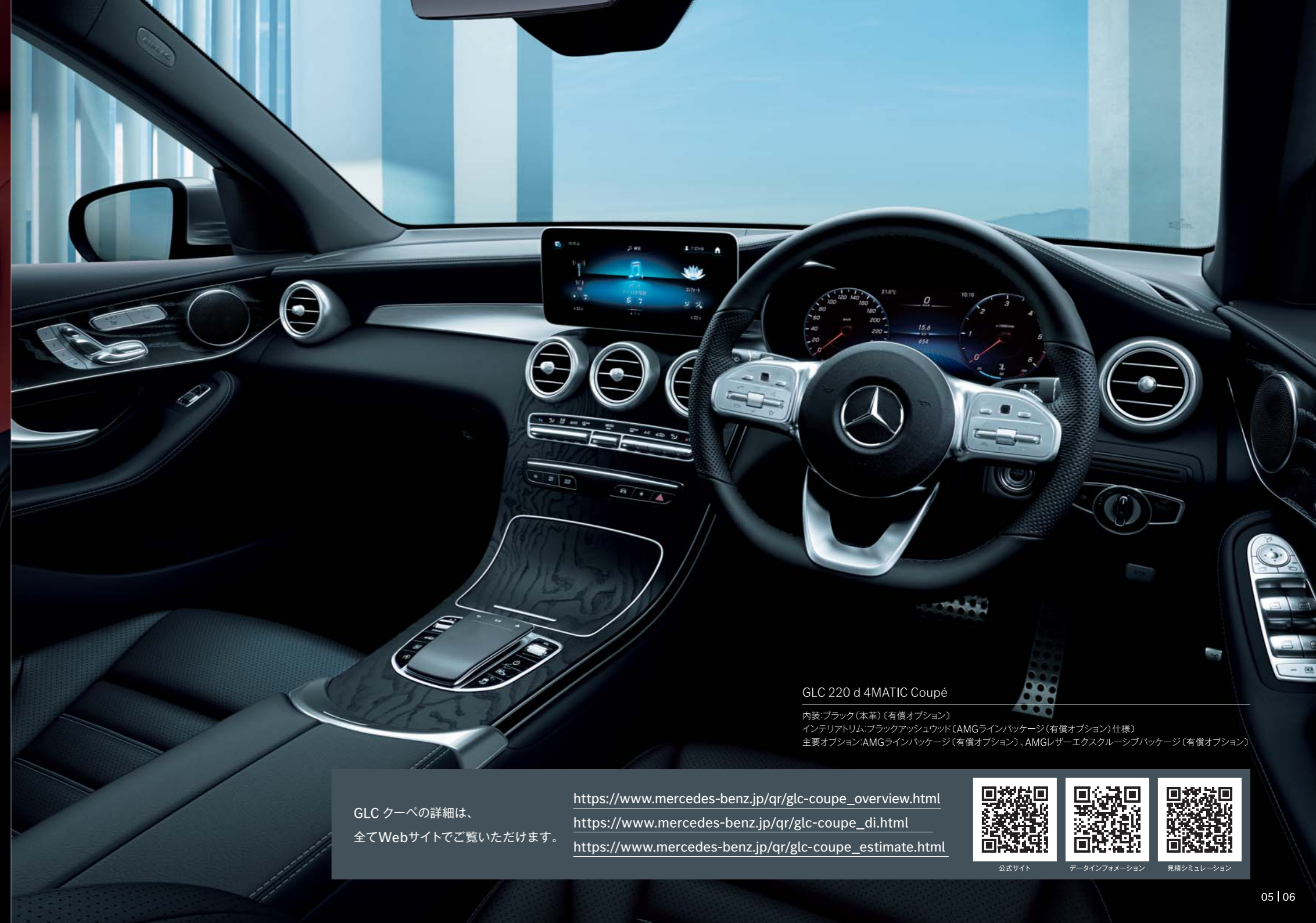
GLC 220 d 4MATIC Coupé

※日本仕様のハンドル位置は右ハンドルとなります。写真の仕様・装備は、日本仕様と異なる場合があります。また、半導体供給不足に伴う生産制約によって、仕様・装備・メーカー希望小売価格が変更になる場合があります。選択できるオプションにつきましては、事前にメルセデス・ベンツ正規販売店にお問い合わせください。