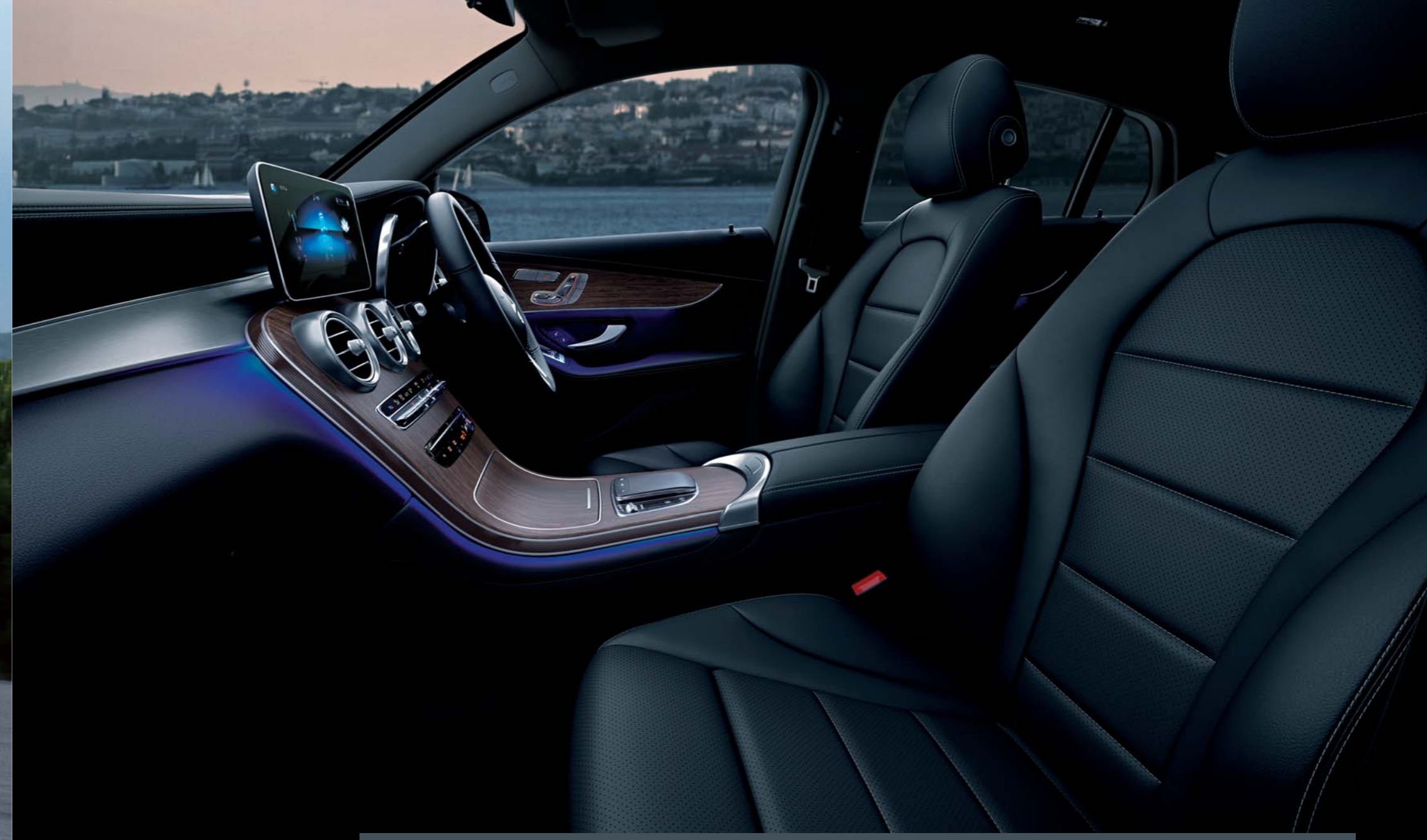
GLC 220 d 4MATIC Coupé

※日本仕様のハンドル位置は右ハンドルとなります。写真の仕様・装備は、日本仕様と異なる場合があります。また、半導体供給不足に伴う生産制約によって、仕様・装備・メーカー希望小売価格が変更になる場合があります。選択できるオプションにつきましては、事前にメルセデス・ベンツ正規販売店にお問い合わせください。