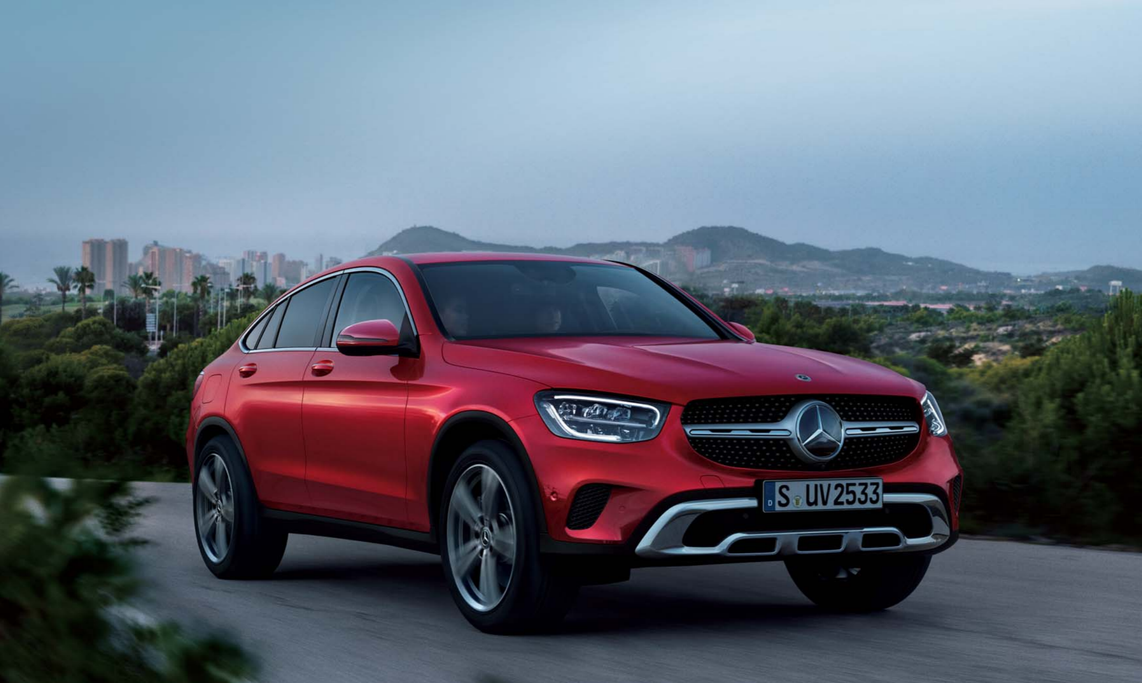
GLC 220 d 4MATIC Coupé