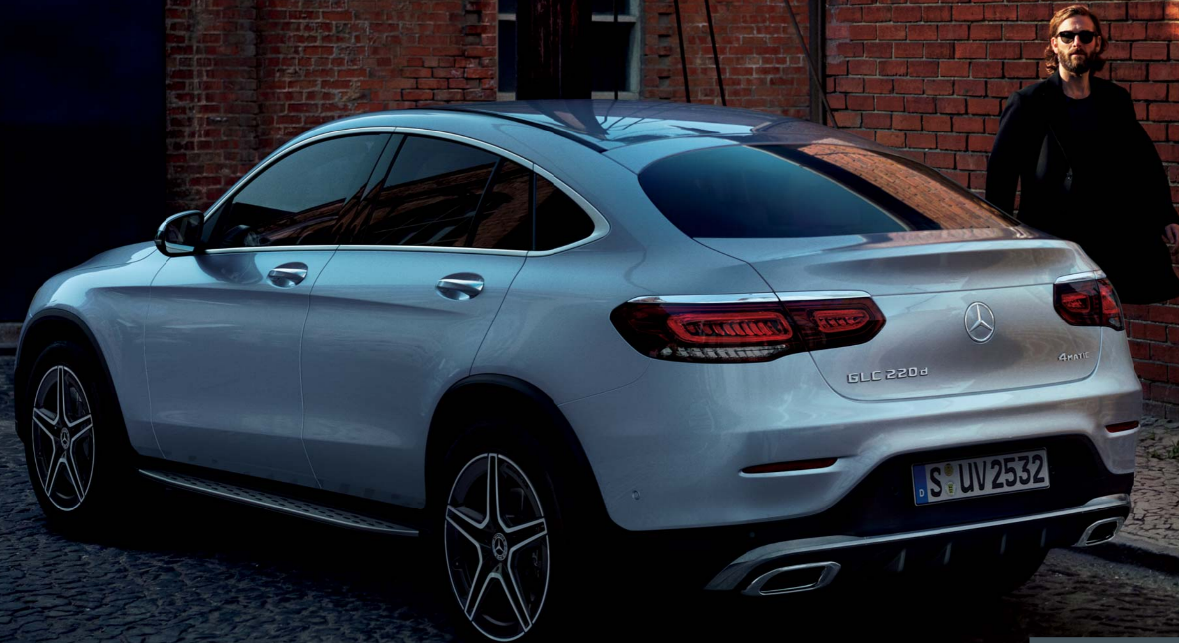
GLC 220 d 4MATIC Coupé

ボディカラー:ハイテックシルバー(メタリックペイント)〔有償オプション〕 主要オプション:AMGラインパッケージ〔有償オプション〕、ランニングボード〔有償販売店オプション〕