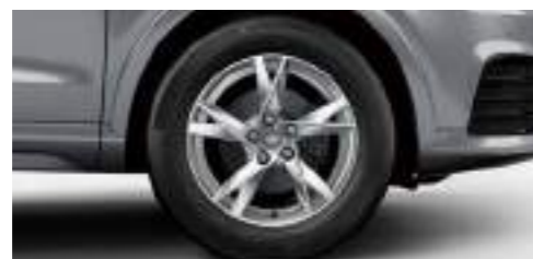
アルミホイール 5スポークYデザイン 7]x17+235/55R17タイヤ [Audi Q3 1.4 TFSI sport, 2.0 TFSI quattro 180PSに標準装備]