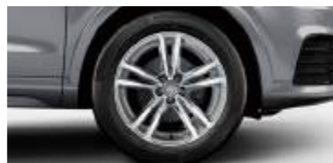
アルミホイール 5パラレルスポークデザイン 7]x18+235/50R18タイヤ [Audi Q3 2.0 TFSI quattro 180PS S lineパッケージ専用]