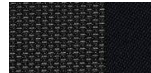
ブラック/イニシャルクロス [Audi Q3 1.4 TFSIに標準装備]