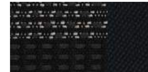
ブラック/エナジークロス [Audi Q3 1.4 TFSI sport, 2.0 TFSI quattro 180PSに標準装備]