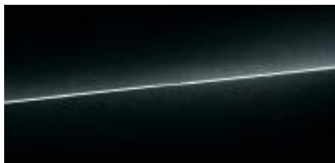
ミストブラック メタリック *1