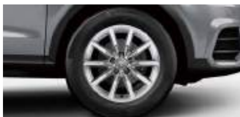
アルミホイール 10スポークデザイン 7]x17+235/55R17タイヤ [Audi Q3 1.4 TFSIに標準装備]