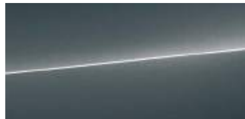
モンスーングレー メタリック *1