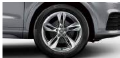
アルミホイール 5スポークダイナミックデザイン 7]x18+235/50R18タイヤ [Audi Q3 1.4 TFSI sport S lineエクステリアパッケージ専用]