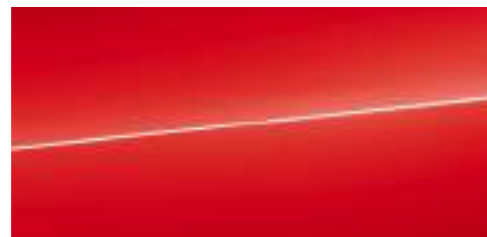
ミサノレッド パールエフェクト *1