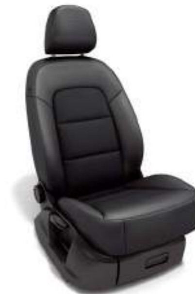
スタンダードシート (フロント) [Audi Q3 1.4 TFSIに標準装備]