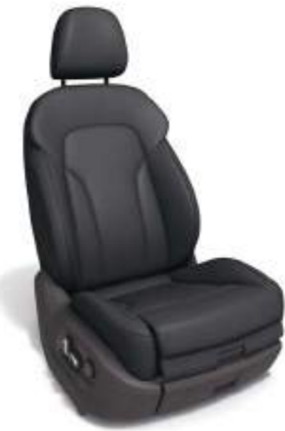
スポーツシート (フロント) *2 [Audi Q3 1.4 TFSI sport, 2.0 TFSI quattro 180PSに標準装備]