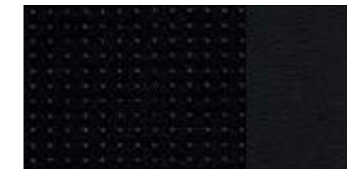
ブラック/スプリントクロスレザー S lineロゴ [Audi Q3 2.0 TFSI quattro 180PS S line専用]