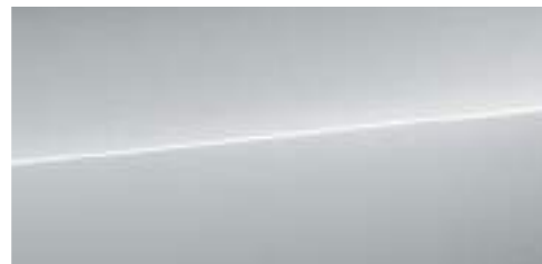
フロレットシルバー メタリック *1