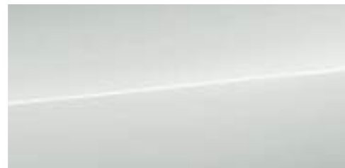
グレイシアホワイト メタリック *1