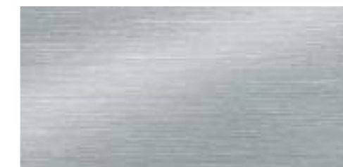
マットブラッシュアルミニウム [Audi Q3 2.0 TFSI quattro 180PS S line専用]