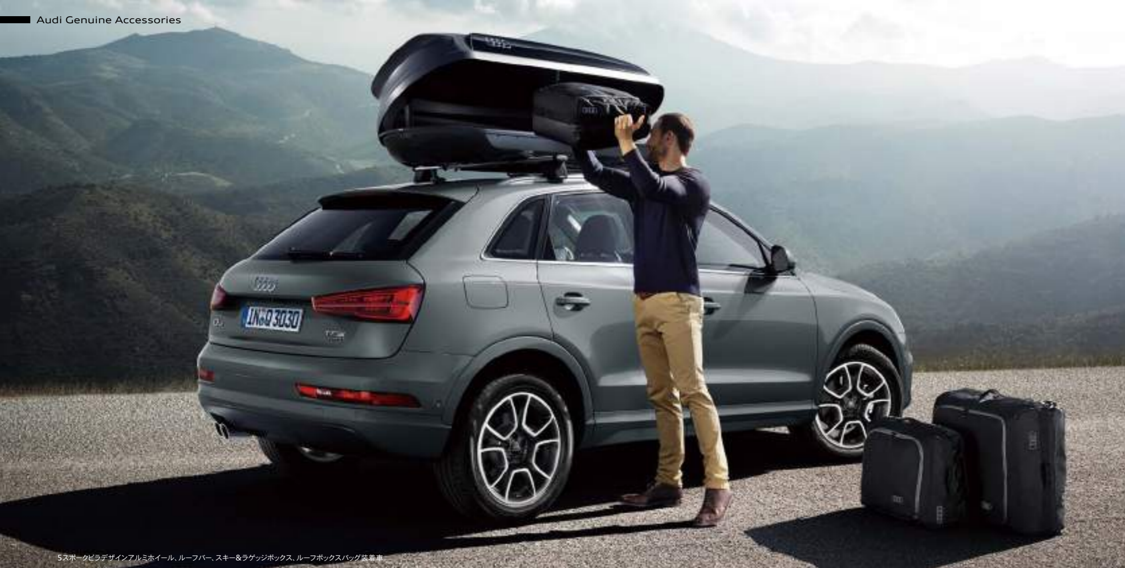
5スポークピラデザインアルミホイール、ルーフバー、スキー&ラゲッジボックス、ルーフボックスバッグ装着車